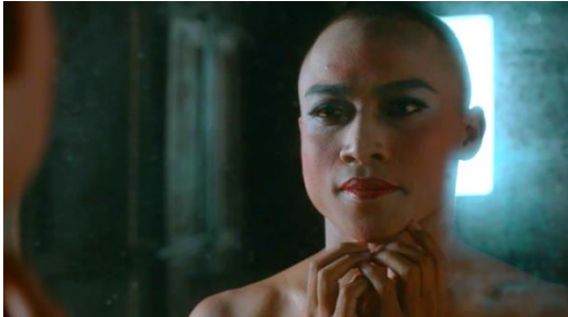
Gambar 4 adegan dalam film “ Ku Cumbu Tubuh Indahku “

Dalam scene Juno remaja di gambarkan menjadi sosok yang lemah gemulai (dalam tindakan maupun cara berbicara), lembut, dan pandai merias wajahnya menjadi sosok laki-laki yang cantik Ekpresi yang di hasilkan pada scene tersebut Juno menampilkan tatapan mata yang tajam pada cermin yang ada di depannya seolah-olah Juno percaya diri akan hasil riasannya sendiri. Tatapan tersebut juga menggambarkan tatapan kosong Juno yang memberi pesan begitu beratnya beban hidup Juno yang penuh dengan traumatik serta tekanan lingkungan sekitar sehingga ia harus memutuskan untuk bekerja menjadi seorang penari agar dapat bertahan hidup. (Widyatama, 2006) mengungkapkan bahwa seorang dengan karakter lembut, lemah gemulai, wajah penuh make-up, cantik rambut panjang, tidak gesit, memperlihatkan lekuk tubuh maka diidentifikasi sebagai seorang perempuan. Cerita yang disampaikan di film “ Ku Cumbu Tubuh Indah Ku” merupakan film yang sudut pandangnya mengarah pada laki-laki yang memiliki sifat yang feminim. Karakter lemah lembut, kalem, dan pendiam biasanya direpresentasikan pada sosok wanita yang sejatinya membutuhkan perlindungan, mengekspresikan kelemahan, lentik dan lemah gemulai.