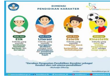
Gambar 2 Dimensi dalam Pendidikan Karakter

Berdasarkan gambar 2 tentang dimensi dalam pendidikan karakter, dapat dipahami bahwa gerakan penguatan pendidikan karakter sebagai fondasi dan ruh utama pendidikan yang secara spesifik terbagi dalam empat dimensi, yaitu: etik, literasi, estetik, dan kinestetik. Karakteristik karakter etik ditunjukkan dengan ruh individu yang memiliki korohanian mendalam, beriman, dan bertakwa. Karakteristik karakter literasi ditunjukkan dengan ruh individu yang memiliki keunggulan akademis sebagai hasil pembelajaran dan proses pembelajaran sepanjang hayat. Karakteristik karakter estetik ditunjukkan dengan ruh individu yang memiliki integritas moral, rasa berkesenian, dan berkebudayaan. Dan karakteristik karakter kinestetik ditunjukkan dengan ruh individu yang sehat dan mampu berpartisipasi aktif sebagai warga negara.