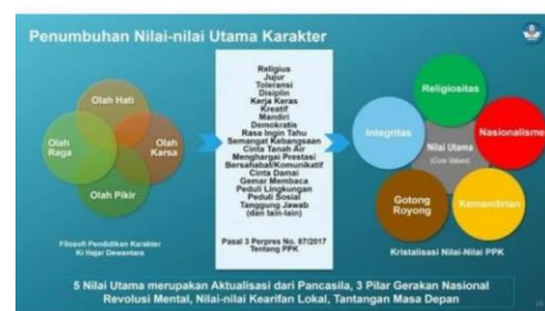
Gambar 1 Lima Nilai Utama dalam Pendidikan Karakter

Untuk nilai utama dalam pendidikan karakter ditampilkan dalam gambar 1. Untuk dimensi dalam pendidikan karakter ditampilkan dalam gambar 2. Dan untuk ruang lingkup dalam pendidikan karakter ditampilkan dalam gambar 3. Tiga buah gambar tentang pendidikan karakter bangsa Indonesia di bawah ini disertai dengan penjabaran segingga menunjukkan kejelasan arah penanaman pendidikan karakter di lingkungan jalur pendidikan formal.